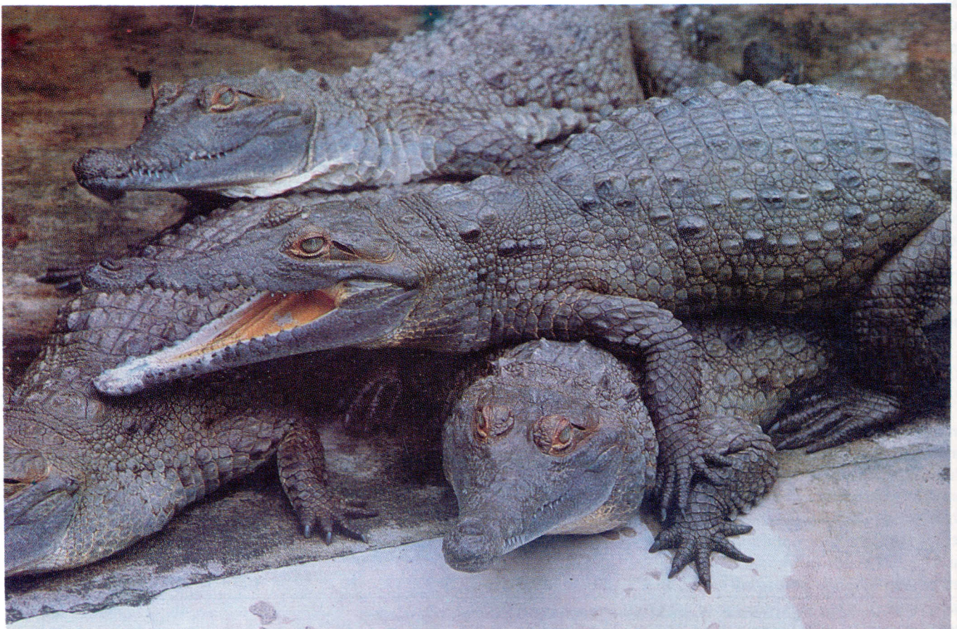
Figura 3. Crías de C. intermedius de 18 meses de edad.

(*) Estación de Biología Tropical "Roberto Franco".