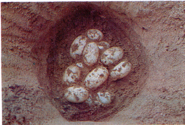
Figura 2. Nidada de C. intermedius en la EBTRF.