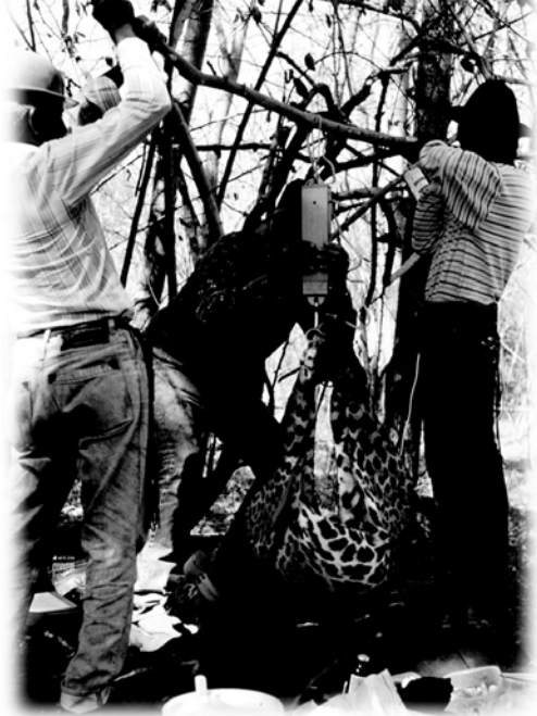
Hato Piñero ha sido pionero en la investigación de las situaciones de depredación de felinos sobre el ganado doméstico, desarrollándose técnicas de manejo y utilización de cercas eléctricas para aminorar este problema. En la foto el pesaje de una hembra de jaguar tranquilizada y provista de collar radiotransmisor

identificadas, como un aporte al conocimiento de las especies botánicas de los Llanos Centrales, con 180 especies nuevas para la flora del estado Cojedes y cinco especies nuevas para la ciencia a nivel mundial.